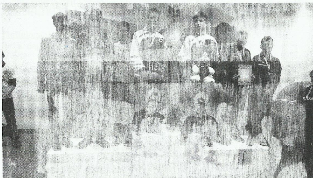
Fiú puskás csapat Serdülő OB III. hely

A Pécs Városi Lövészklub Közgyűlése a 2018. évi beszámolót a 2019. május 31-én megtartott közgyűlésén elfogadta.